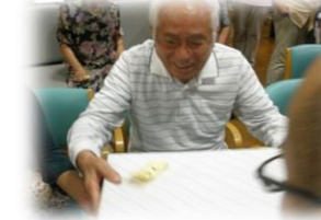
当選おめでとうございます！